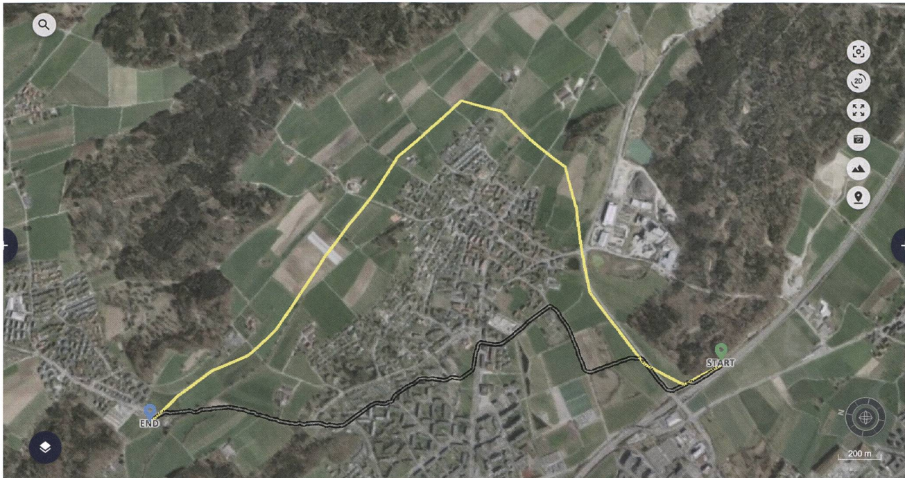
Vergleich zweier 110-kV-Leitungen (gelb = Freileitung; schwarz = Erdkabel).

zwischen Wirtschaftlichkeit und optimaler Trasseeführung gerecht zu werden. Im Rahmen der Digitalisierungsinitiative Grid 4.0 baut Axpo in Zusammenarbeit mit dem Software-Entwickler Gilytics, einem ETH-Spin-off, die Kompetenzen für eine Software-gestützte Planung ihrer Hochspannungsleitungen auf. Die Software Pathfinder modelliert mittels Einbindung digitaler Karten die besten Routing-Lösungen unter Berücksichtigung aller relevanter Aspekte und stellt sie visuell dar. Die Digitalisierung der Leitungsplanung ist ein Bestandteil der digitalen Transformation der Axpo und eine wichtige Basis für eine moderne Energieversorgung. Damit bieten sich neue Möglichkeiten, um den hohen Anforderungen der Energiezukunft intelligent zu begegnen.