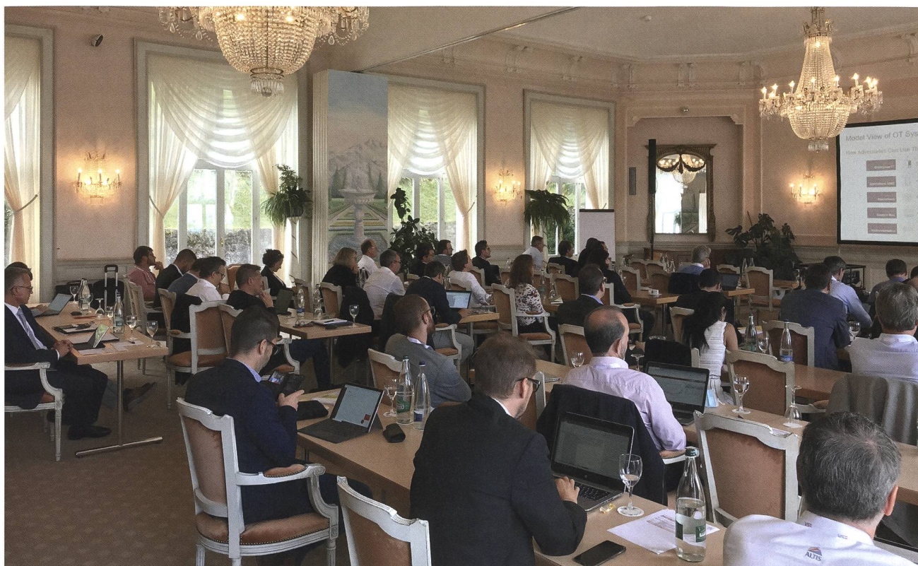
Journées romandes des directeurs et cadres 2021.