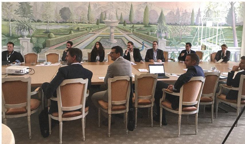
Atelier sur la sobriété énergétique.

l'objectif climatique de zéro émission nette en 2050, le développement de l'innovation et de l'efficacité énergétique, le développement de l'orientation client, ainsi que la priorité qu'est le renforcement de la sécurité de l'approvisionnement en électricité.