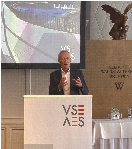
Werner Luginbühl machte der Betriebsleitertagung erstmals als ElCom-Präsident seine Aufwartung.

eine Sondergenehmigung, weil sie innerhalb der bestehenden Gesetze und Regularien nicht möglich wären, oder sie finden gleich komplett im Ausland statt wie beispielsweise die Energiebeschaffungsplattform «Elblox» von Axpo. Mit einer «Regulatory Sandbox» sollen deshalb Möglichkeiten geschaffen werden, um temporär von den Regeln des StromVG abzuweichen, damit innovative Projekte ausprobiert werden können.