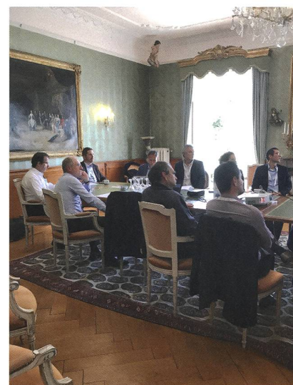
Atelier avec CommuneRenove.