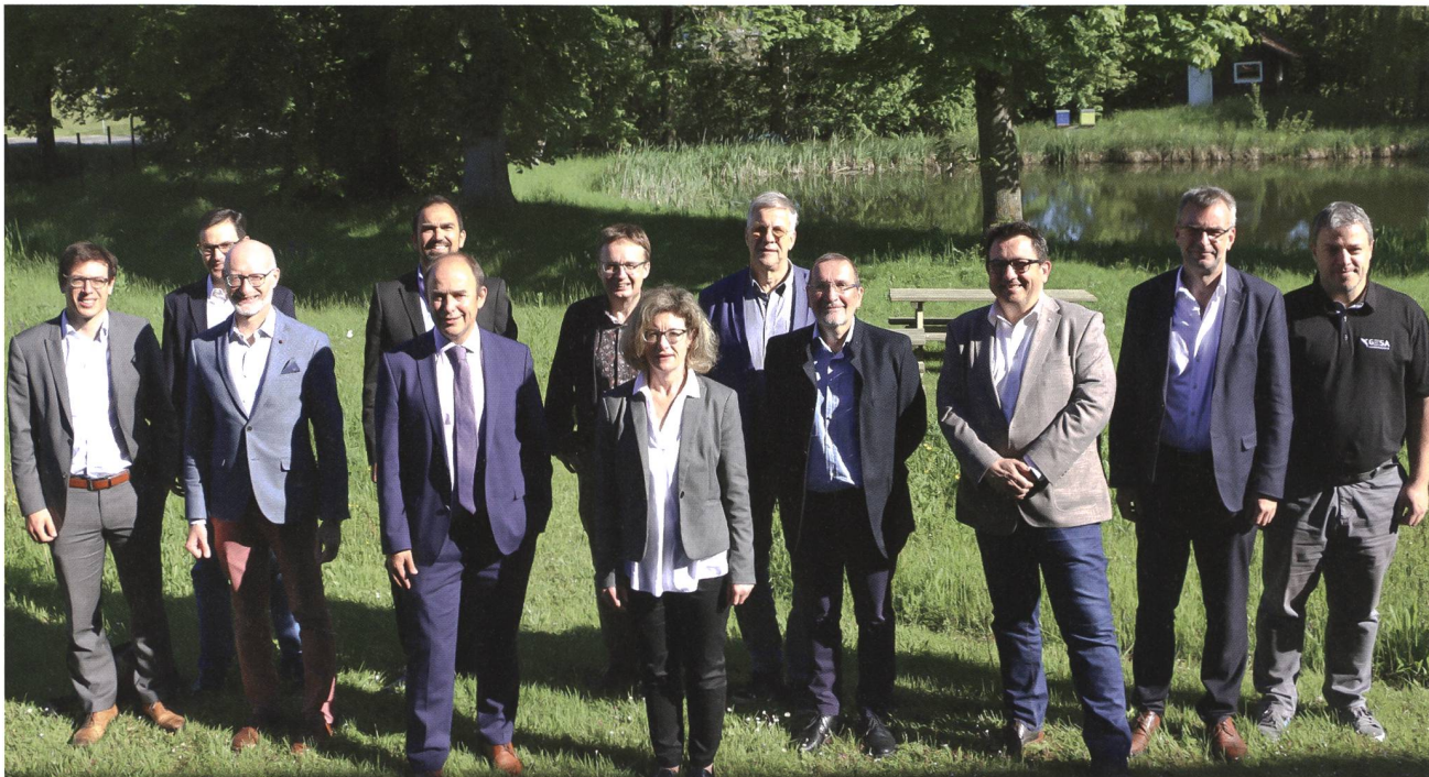
Lors de la fondation de Smart Data Energie.