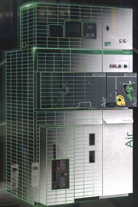
Set Series SM AirSeT

Découvrez SM AirSeT, le nouvel appareillage de commutation moyenne tension sans SF6, pour plus de durabilité et d'efficacité.