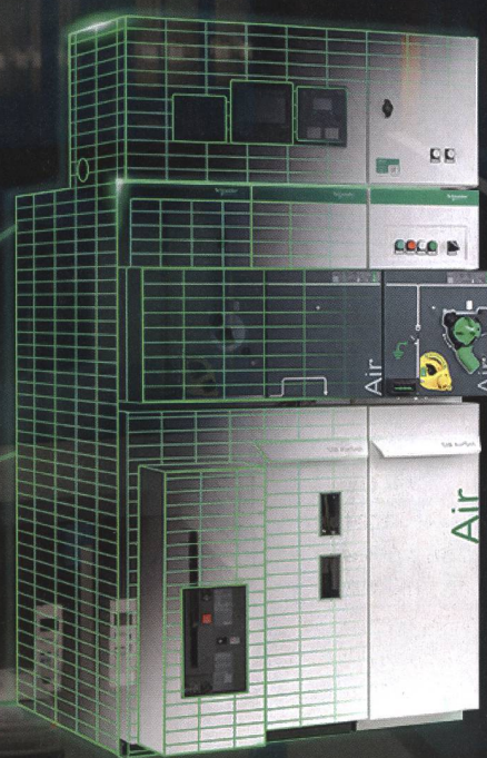
Set Series SM AirSeT

Découvrez SM AirSeT, le nouvel appareillage de commutation moyenne tension sans SF6, pour plus de durabilité et d'efficacité.