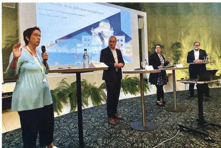
Figure 4 Isabelle Chevalley (conseillère nationale, PVL/VD), Pierre-André Page (conseiller national, UDC/FR) et Delphine Klopfenstein Brogгинi (conseillère nationale, Les Verts/GE).

nalités en matière de technologie et d'innovation sont réelles, il est indispensable d'avoir un cadre législatif. L'UE va mettre en place des barrières commerciales pour les pays tiers ayant un niveau d'ambition jugé insuffisant dans les domaines du climat et de la durabilité. Avec le refus de la Loi sur le CO 2 , il va être difficile pour la Suisse de prétendre poursuivre le même objectif que l'UE. Des ajustements vont également être nécessaires concernant l'accord entre l'UE et la Suisse sur le couplage de leurs systèmes d'échange de quotas d'émission.