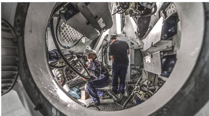
Figure 3 Les interventions sur place sont mieux ciblées grâce à l'analyse de la salle de contrôle, et leurs retours permettent l'amélioration continue des algorithmes.

des modes de défaillance, de leurs effets et de leur criticité (Failure Mode and Effects Analysis, FMEA), réalisée avec des experts des turbines et de leur maintenance. L'analyste de la salle de contrôle peut alors trier le contenu de la liste, modifier l'échelle de gravité des entrées, commenter les anomalies et générer des demandes d'intervention pour les équipes techniques (figure 3).