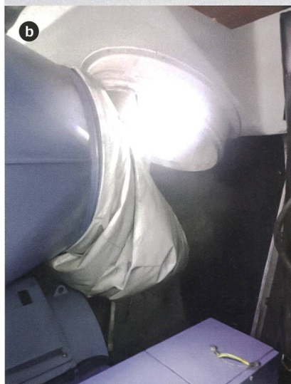
Figure 4 Exemples de défaillances détectées par l'algorithme: défaut sur la boîte de transmission (a) et tuyau de ventilation arraché (b).