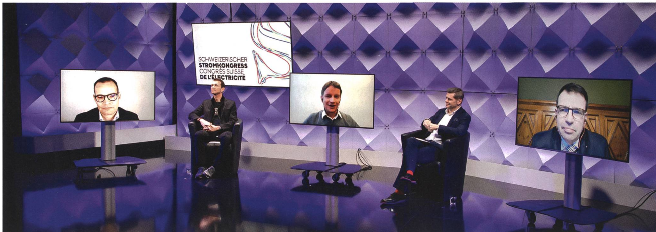
Le Congrès suisse de l'électricité de cette année a été effectué sous forme hybride.