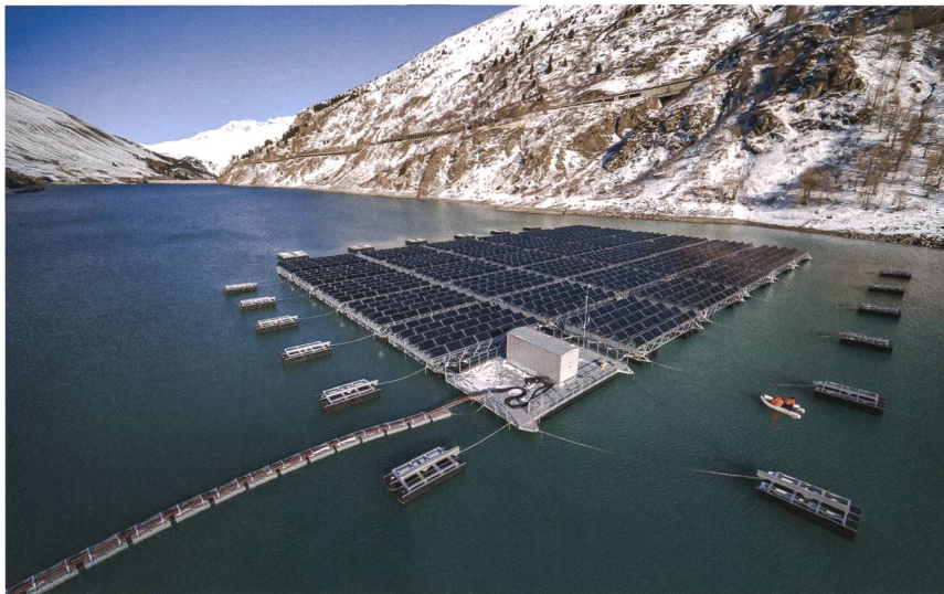
PV-Anlage auf dem Lac des Toules.

Diese Tatsache rückt einmal mehr die Fragen zu den Importen und zur Stromversorgungssicherheit in den Mittelpunkt der Debatten. Sowohl die Branche als auch die Eidgenössische Elektrizitätskommission (ElCom) weisen auf diese grosse Herausforderung für die Schweiz hin. Die ElCom hat bereits mehrmals vor den Risiken einer Abhängigkeit von Importen gewarnt.