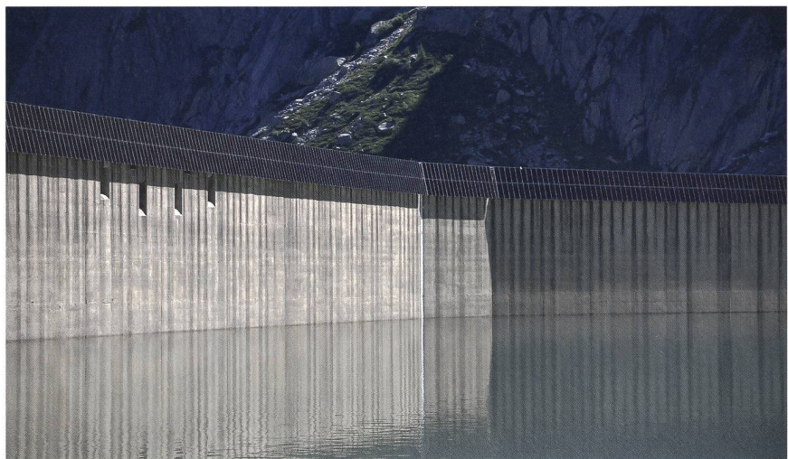
Barrage de l'Albigna.

mande d'ailleurs de ne pas dépasser une dépendance à l'importation de 10 TWh (ou 20 % de la consommation) en hiver. Un effort massif d'investissement dans l'auto-approvisionnement sera indispensable pour y parvenir.