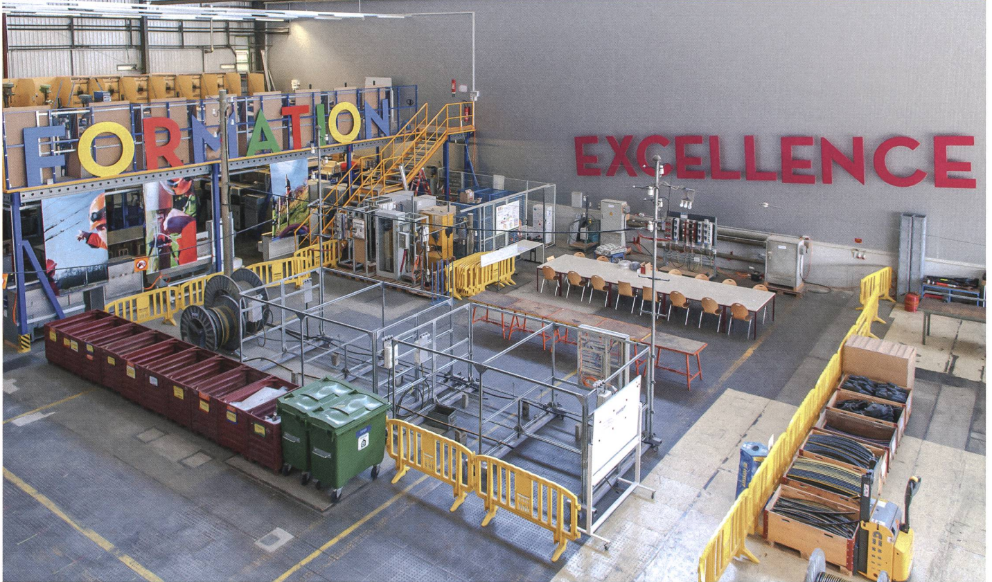
Halle d'exercices Cifer.