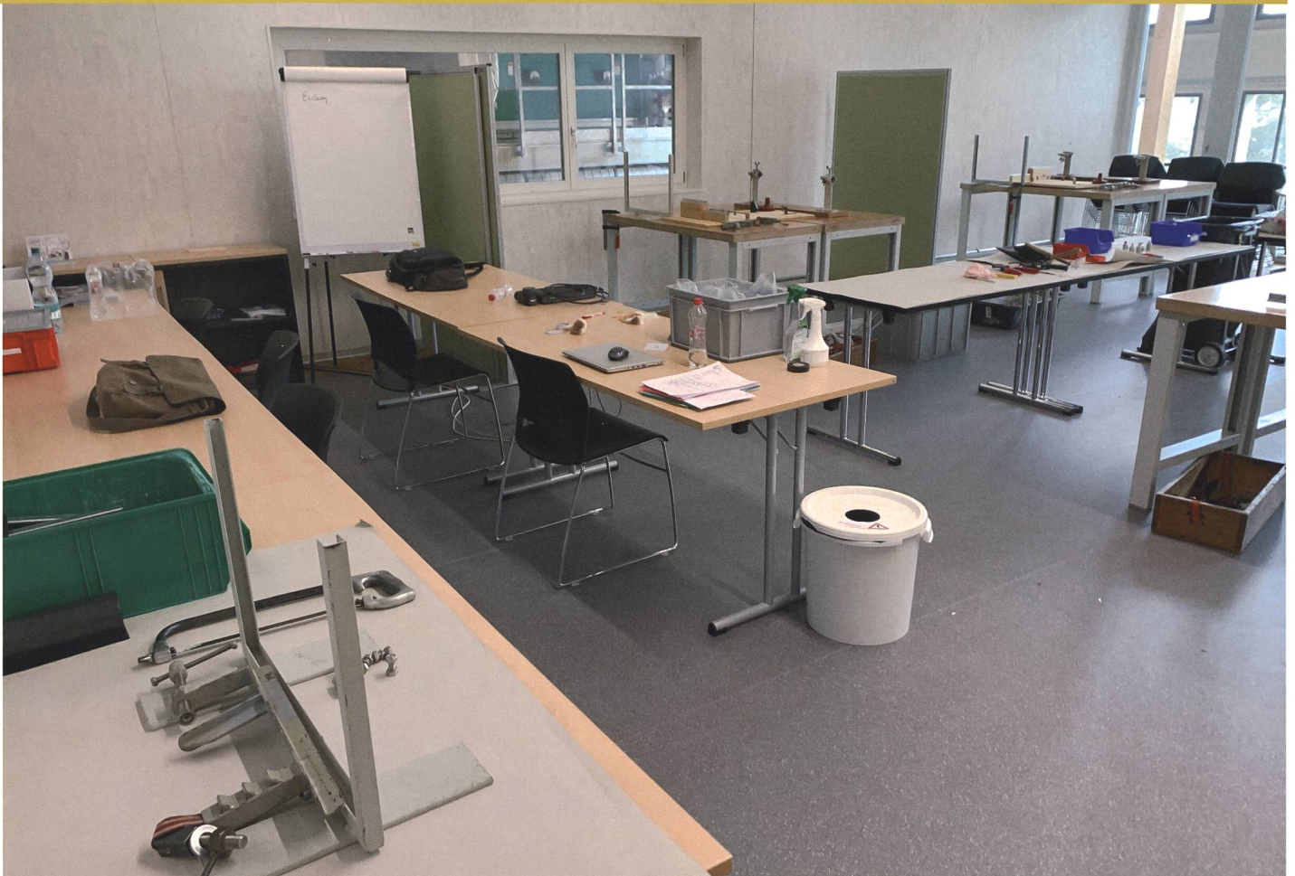
Ruhe vor dem Sturm: Alles ist vorbereitet für das Qualifikationsverfahren.