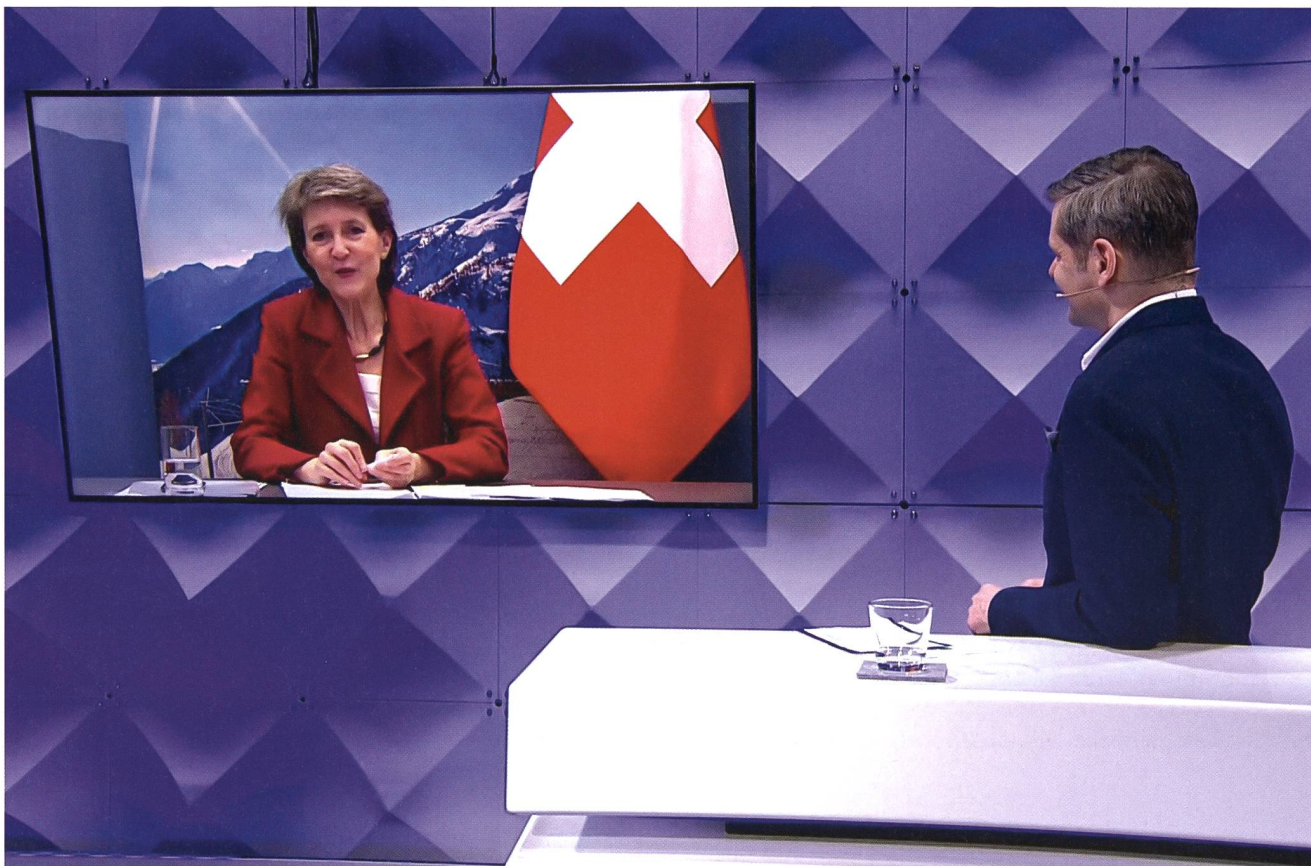
Bundesrätin Simonetta Sommaruga im Gespräch mit Moderator Urs Gredig.

La Conseillère fédérale Simonetta Sommaruga en conversation avec l'animateur Urs Gredig.