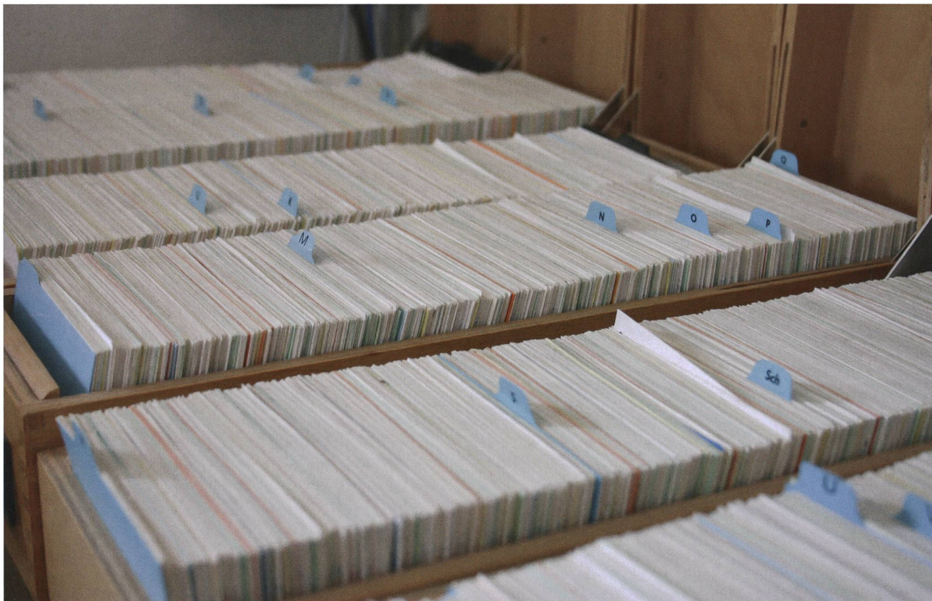
Die Regeln, was EVUs mit den Daten über ihre Kunden tun dürfen, wurden verschärft.

Datenschutz durch Technik und datenschutzfreundliche Voreinstellungen Der Verantwortliche ist verpflichtet, bei der Planung der Datenbearbeitung diese technisch und organisatorisch so auszugestalten, dass die Datenschutzvorschriften eingehalten