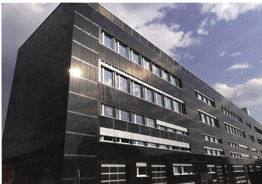
Das mit 2100 Solarpanels verkleidete Gebäude in Wallisellen.

2100 Solarpanels mit der Fläche eines Fussballfeldes kleiden den Walliseller Gewerbepark «K3 Handwerkcity» rundherum ein. Die Solaranlage erzeugt mit einer installierten Leistung von 663 kW Nennleistung jährlich etwa 400 000 Kilowattstunden erneuerbaren Strom. Die produzierte Energie dient vorrangig dem Eigenbedarf und entspricht in etwa dem jährlichen Strombedarf von 100 Haushalten oder 200 Elektroautos. Die 3900 m 2 grosse Solaranlage an den Fassaden und auf dem Dach des Gewerbeparks gehört auch zu den grössten gebäudeintegrierten Solaranlagen der Welt.