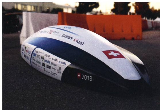
Rückansicht der Swissloop-Shell.

Die dem Hyperloop zugrunde liegende Idee, durch Röhren zu fahren, in denen sich kaum Luft befindet, ist nicht neu. Erste Visionen hierzu sind über 200 Jahre alt. Heutzutage haben sich aufgrund der technischen Möglichkei-