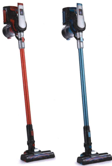
Betroffener Zyklonen Akku-Hand- und Stielsauger mit Artikelnummer 99135.