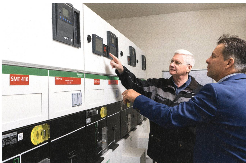
Die Daten und Zustandsangaben der Anlagen können sowohl vor Ort ...

Möglich wird dies durch digitale Prozesse, die aufgenommene Daten und Werte analysieren. Bei UCB entschied