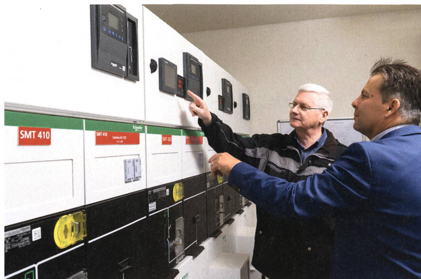
Les données et l'état des systèmes peuvent être consultés aussi bien sur place ...

Les exploitants d'installations et les chefs d'entreprise mettent l'accent sur la détection anticipée des incidents, la restauration immédiate de l'alimentation énergétique et la prévention des causes d'incendie. Dans une telle optique, un intervalle d'intervention purement périodique et statique, tel qu'auparavant défini par UCB Farchim, ne suffit plus. Afin d'obtenir une vision globale et consolidée de l'évolution de l'état de l'ensemble du réseau basse et moyenne tension, les interventions de maintenance devraient dorénavant être menées à la fois de manière continue, évolutive, rapide et rentable. De plus, les installations pourront être surveillées de manière dynamique, localement ou à distance, et contrôlées en conséquence. Des processus numériques analyseront les données et les valeurs enregistrées.