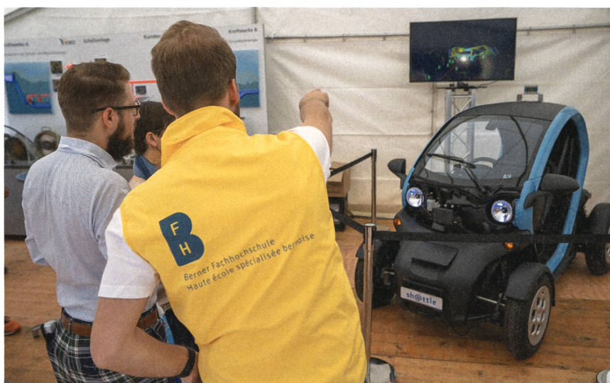
Première exposition du véhicule Sh@ttle lors du Grand Prix de Formule E à Berne en 2019.

Une fois ce stade d'automatisation atteint, les progressions du projet devront être obtenues à l'aide du « deep learning ». La mise en place d'un algorithme performant permettant au véhicule d'adapter son comportement aux différents éléments rencontrés de manière aléatoire, est une tâche beaucoup plus complexe. Cette méthode va permettre à la machine d'apprendre comment réagir seule en présence de différents cas, sans avoir à programmer manuellement chaque détail.