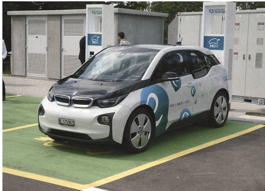
Die Schnellladestationen an der A2.

Ab sofort können auf dem Autobahnrastplatz Inseli am Sempachersee in Fahrtrichtung Luzern Elektrofahrzeuge mit elektrischer Energie aufgeladen werden. Ebenfalls in Betrieb genommen wurden die Ladestationen in der Gegenrichtung auf dem Rastplatz Chilchbüel. Der Bau von Schnellladestationen entlang der Schweizer Autobahnen ist eine Massnahme der Roadmap Elektromobilität 2022 des Bundes zur Förderung der Elektromobilität. Insgesamt sollen in der Schweiz in den nächsten Jahren auf rund 100 Rastplätzen Schnellladestationen für Elektrofahrzeuge installiert werden. Primeo Energie und Alpiq E-Mo-