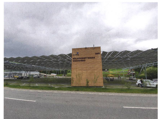
Das ausgefaltete Solardach.

Die SAK (St. Gallisch-Appenzellische Kraftwerke AG) hat mit der Luftseilbahn Jakobsbad-Kronberg AG ein 4000 m 2 grosses Photovoltaik-Faltdach in Betrieb genommen. Die Anlage ist in dieser Bauweise, installiert über einem Parkplatz, weltweit einzigartig. Mit dem Leuchtturmprojekt setzt die SAK ein starkes Zeichen für die Energiewende in der Ostschweiz. Privatpersonen und Unternehmen haben die Möglichkeit, Panel-Nutzungsrechte zu erwerben. MR