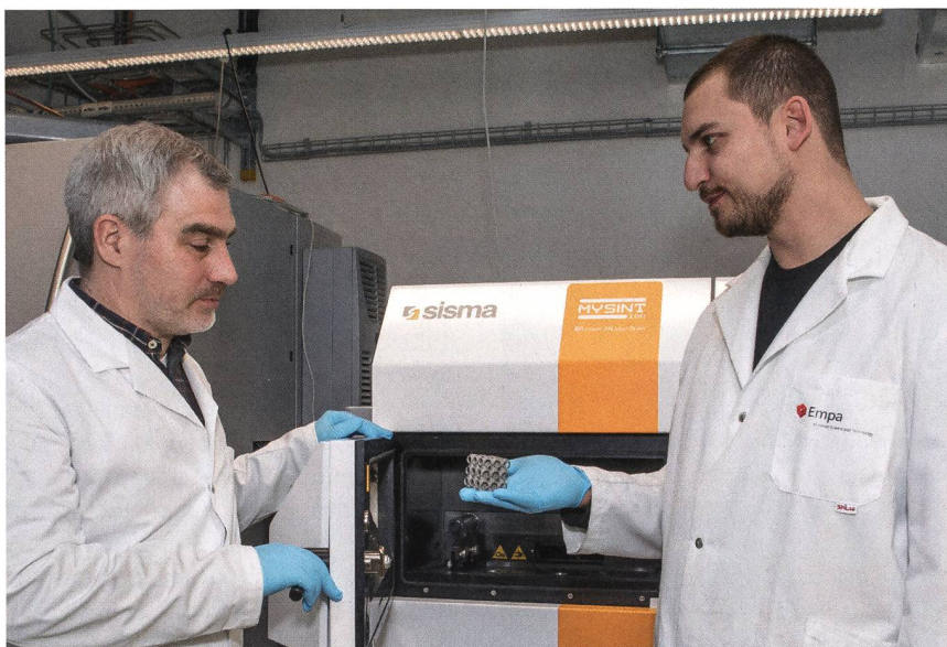
Feintuning von Edelstahl-Legierungen mit 3D-Drucker.