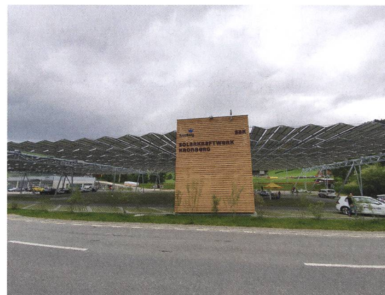
Das ausgefaltete Solardach.

Die SAK (St. Gallisch-Appenzellische Kraftwerke AG) hat mit der Luftseilbahn Jakobsbad-Kronberg AG ein 4000 m 2 grosses Photovoltaik-Faltdach in Betrieb genommen. Die Anlage ist in dieser Bauweise, installiert über einem Parkplatz, weltweit einzigartig. Mit dem Leuchtturmprojekt setzt die SAK ein starkes Zeichen für die Energiewende in der Ostschweiz. Privatpersonen und Unternehmen haben die Möglichkeit, Panel-Nutzungsrechte zu erwerben. MR