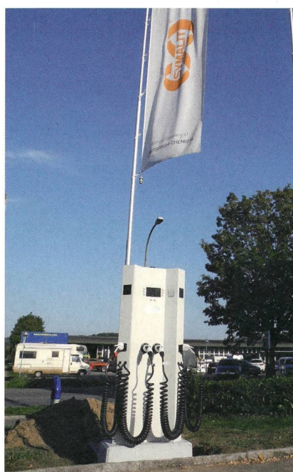
Einsatzbereite Elektro-Tanksäule bei der Symalit AG.

Die Power-Charger-Box entspricht somit klar dem Kaiteki-Gedanken unseres Mutterhauses, d. h. unser Verhalten möglichst nachhaltig und ressourcenschonend stets zu hinterfragen und zu optimieren. Das jüngste Produkt, welches standardmässig in zwei Grössen gefertigt wird, schlägt sich auch in den Investitionen der Symalit AG nieder – so ist die erste Ladestation auf dem Firmenareal, in Zusammenarbeit mit der AEW Energie AG, bereits erstellt worden und es wird wohl nicht mehr lange dauern, bis ein erstes Elektro-Firmenfahrzeug zum Einsatz kommt.