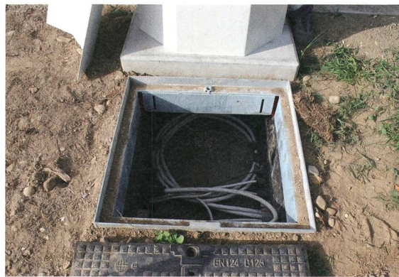
Ordnung im Schacht ermöglicht sauberes Arbeiten.

Schacht: Ein Teil dient als Kabelschacht und wird mittels Gussdeckel ebenerdig verschlossen, auf den zweiten Teil kommt der teilweise sichtbare Betonsockel als Fundament für die Ladestation. Ein entscheidender Vorteil dieser Ladestation ist die unkomplizierte, schnelle und dadurch kostengünstige Installation. Aufgrund des Unterbaus kann auf eine Schalung verzichtet werden und die notwendigen Einführungsöffnungen