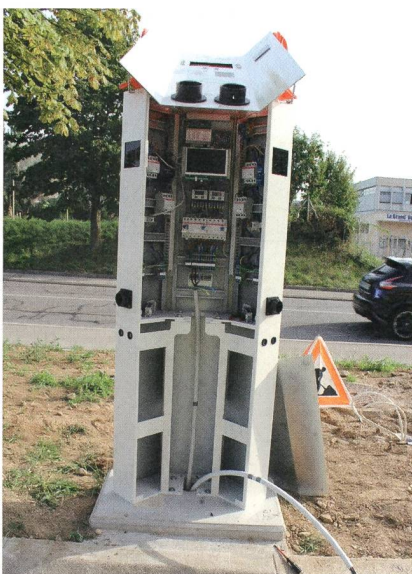
Innenleben mit jeder Menge Elektronik.

Vor knapp einem Jahr wurden erste Prototypen von Kabelschächten aus glasfaserverstärktem, rezyklierten Polyethylen produziert. Erste mögliche Kunden wurden bereits in der Planungsphase früh miteinbezogen und es entstand ein Gemeinschaftswerk aus einem zweiteiligen