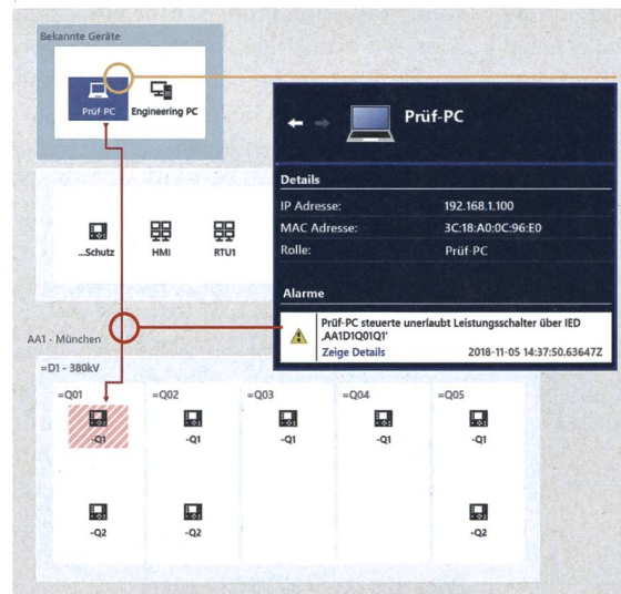
Bild 1 Grafische Alarmanzeige anstelle einer kritischen Ereignisliste.

Im Netzwerkentwurf der US Rothenburg werden in jedem Bereich Hürden eingebaut, die einen Angriff auf das Netzwerk erschweren sollen. Das Einstiegsbild zeigt das Prozessnetzwerk der US Rothenburg.