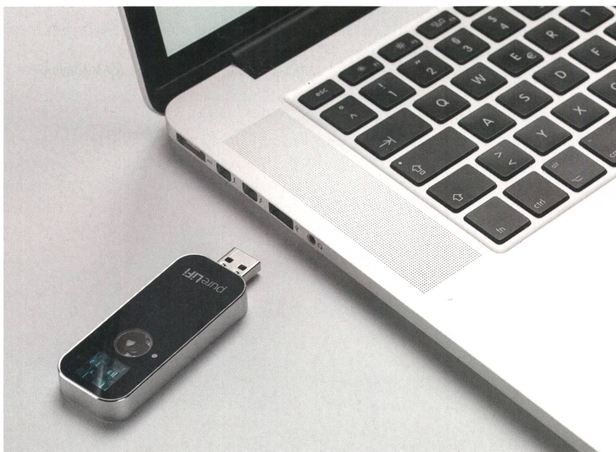
Les signaux modulés par les drivers Li-Fi spéciaux intégrés aux luminaires sont détectés par des capteurs ou photodétecteurs branchés ou intégrés aux ordinateurs, smartphones, tablettes ou autres appareils.

Le Li-Fi permet également d'assurer la sécurité d'une tout autre façon. Les perturbations électromagnétiques causées par le Wi-Fi sont connues pour interférer avec d'autres appareils à proximité. Le Li-Fi, lui, ne présente aucun danger. Il consiste exclusive-