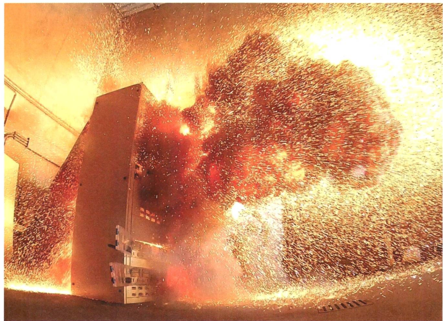
Störlichtbogenprüfung ohne Schutzmassnahmen.