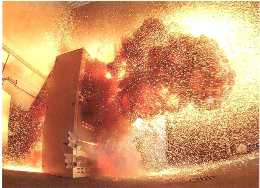
Störlichtbogenprüfung ohne Schutzmassnahmen.