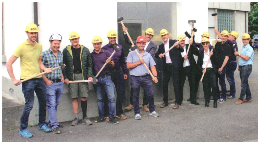
Ein «hammermässiger» Spatenstich zum neuen Kraftwerk Säggüetli.

Die St. Gallisch-Appenzellische Kraftwerke AG (SAK) ist Eigentümerin der EW Schils AG und Initiantin der umfassenden Erneuerungsarbeiten an den Kraftwerksanlagen am Schilsbach. Gemeinsam mit den Verantwortlichen der Betreibergesellschaft EW Schils AG hat die SAK Mitte Juli mit einem symbolisch als Hammerschlag ausgeführten Spatenstich den Startschuss zu den Sanierungsarbeiten gegeben.