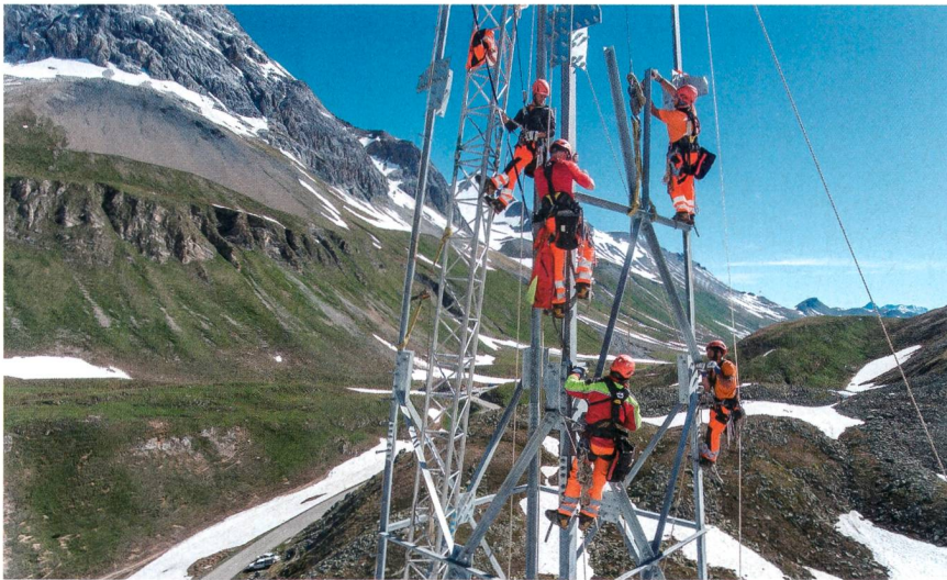
Montage der Masten am Albulapass.