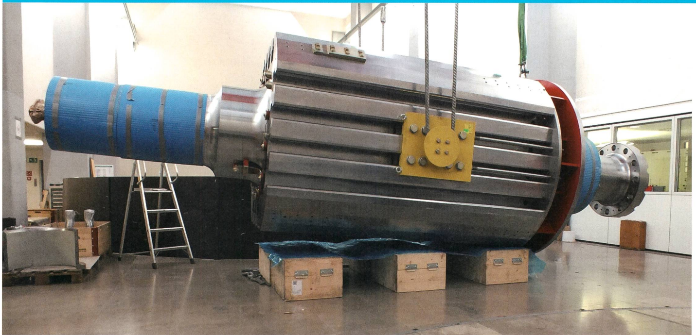
Rotorkörper der neuen vierpoligen Synchronmaschine, rechts Bremsring mit 2,5 m Aussendurchmesser und Flansch zur Turbinenkupplung, links Wellenende für Erregergenerator.