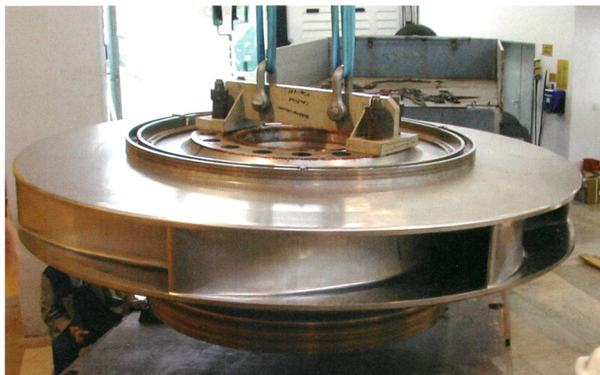
Bild 1 Laufrad einer Francis-Pumpturbine, Aussendurchmesser 3,0 m, Betriebsdrehzahl 8,35 s -1 , Durchfluss ≤ 32 m³/s.

Im März und April 2016 wurden Rotorkörper und Polschuhe getrennt zum Kraftwerk gefahren. Der Rotorkörper wog mit Anschlagmitteln 101 t, was durchgehenden Strasstransport auf einem 26 m langen Zwölfachsfahrzeug mit vierachsiger Zugmaschine erlaubte. Der von Experten und Polizei eskortierte 150-t-Zug fuhr nur nachts, weil auf dem Weg zu befahrende Brücken nicht viel weitere Last vertrugen, und brauchte deshalb für die 770 km lange Strecke über drei Tage.