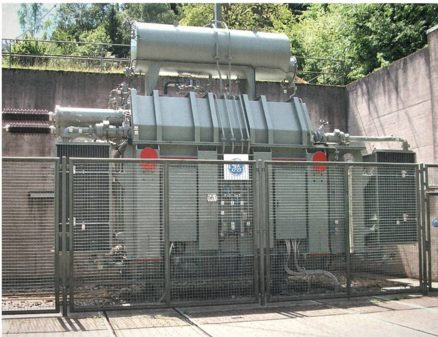
Bild 3 Neuer Blockumspanner 2 AC 10,75/110 kV, 16,7 Hz, Nennleistung 100 MVA, Masse in betriebsbereitem Zustand: 220 t.

lieröl eingefüllt. Damit war er 220 t schwer, was dank besserer Kernbleche und geschickter Bauweise 29 t weniger ist als bei seinem leistungsgleichen Vorgänger. Für seine Nennleistung von 100 MVA genügen drei der vier angebauten Öl-Luft-Wärmetauscher. Der 19-stufige Lastschalter passt die Maschinenspannung 10,75 kV automatisch an 97 kV bis 132 kV Netzspannung an. Der Komplettauftrag mit Transporten kostete 2 Mio. EUR.