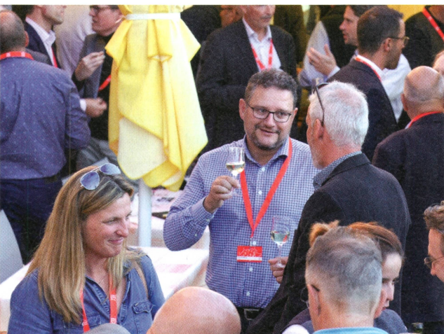
L'apéritif, un moment privilégié.

Événement de réseautage réunissant les cadres et directeurs de la branche, les JDC ont lieu chaque année en septembre. Le rendez-vous en 2019 a déjà été fixé aux 12 et 13 septembre. CR