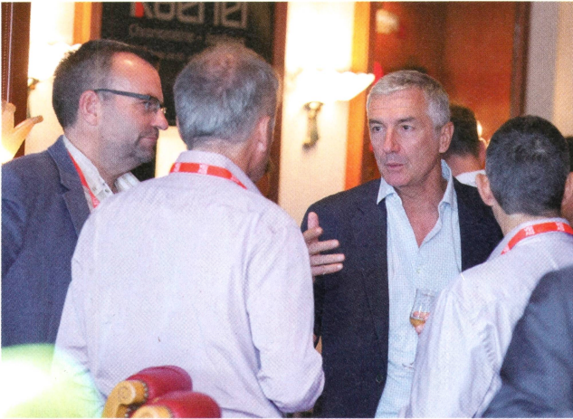
Les JDC sont l'occasion de soigner son réseau.