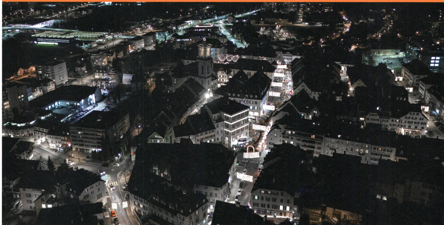
Delémont resplendit sous un nouvel éclairage.