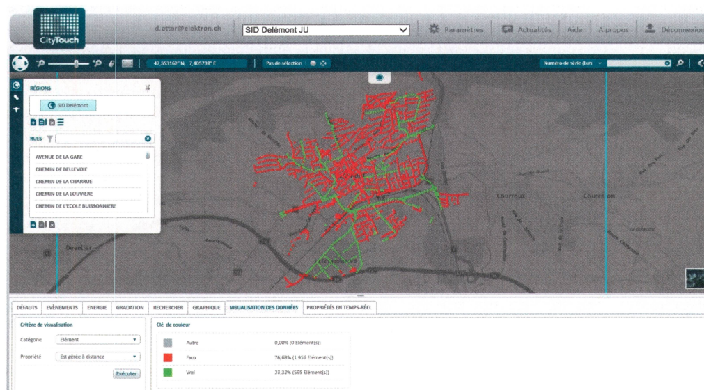
Figure 2 Visualisation de l'assainissement de l'infrastructure d'éclairage à Delémont.

Contrairement à la nécessité d'importer les données dans le cas des luminaires passifs déjà installés, les luminaires connectés communiquent avec le logiciel dès leur mise en service. Après l'installation «plug-and-play», les luminaires transmettent automatiquement toutes les informations les concernant et fournissent ensuite quotidiennement des données de fonctionnement telles que la consommation d'énergie (pour la saisie des coûts liés à l'énergie), les heures de fonctionnement (pour une