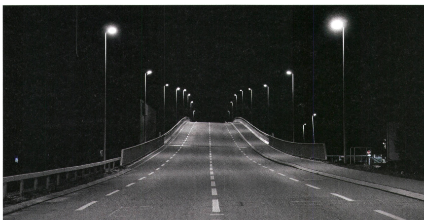
Figure 1 Route principale de Delémont.

Les données importées sont visualisées dans le logiciel basé sur des cartes. Grâce à la saisie des coordonnées géo-