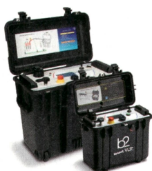
HVA45TD & HVA28TD