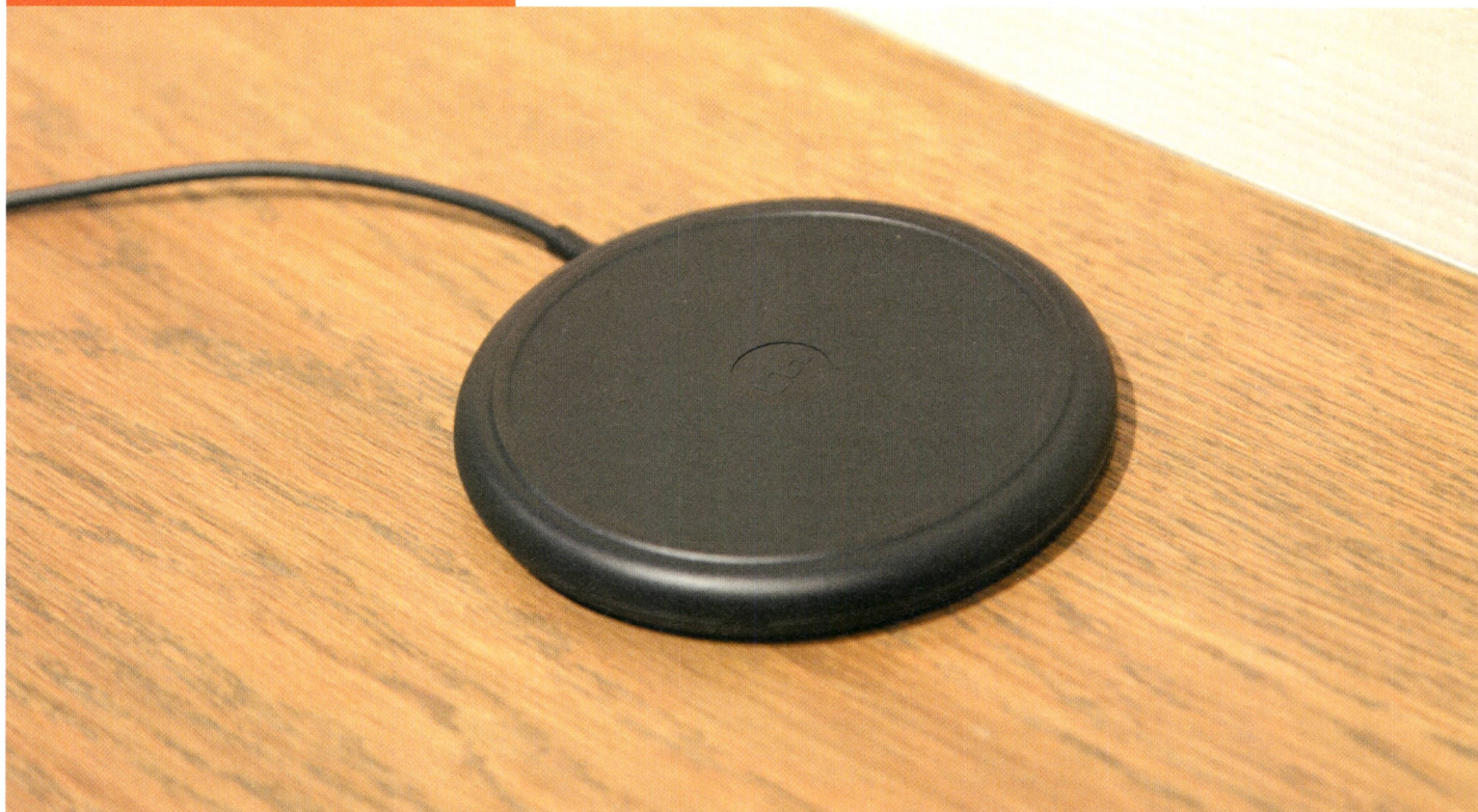
La base de recharge sans fil Qi de Mophie est fine mais solide.