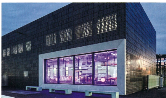
Das EWZ-Unterwerk in Zürich Oerlikon macht moderne Energietechnologien sichtbar.

An der Anlagentagung 2018, die am Mittwoch, 26. September 2018, in Dietikon durchgeführt wird, vermitteln die Referenten aktuelle praxisrelevante Einsichten. Erfahrungen aus Projekten werden präsentiert. In seiner Key Note wird Chefökonom Rudolf Minsch (Economiesuisse) auf die fortschreitende Digitalisierung im Kontext der Berufsbildung eingehen. Die Digitalisierung wird die Anforderungen an die Arbeitskräfte in unserem Land erhöhen. Die Schweiz hat aber mit ihrem dualen Bildungssystem gute Chancen, die entsprechenden Herausforderungen richtig anzugehen.