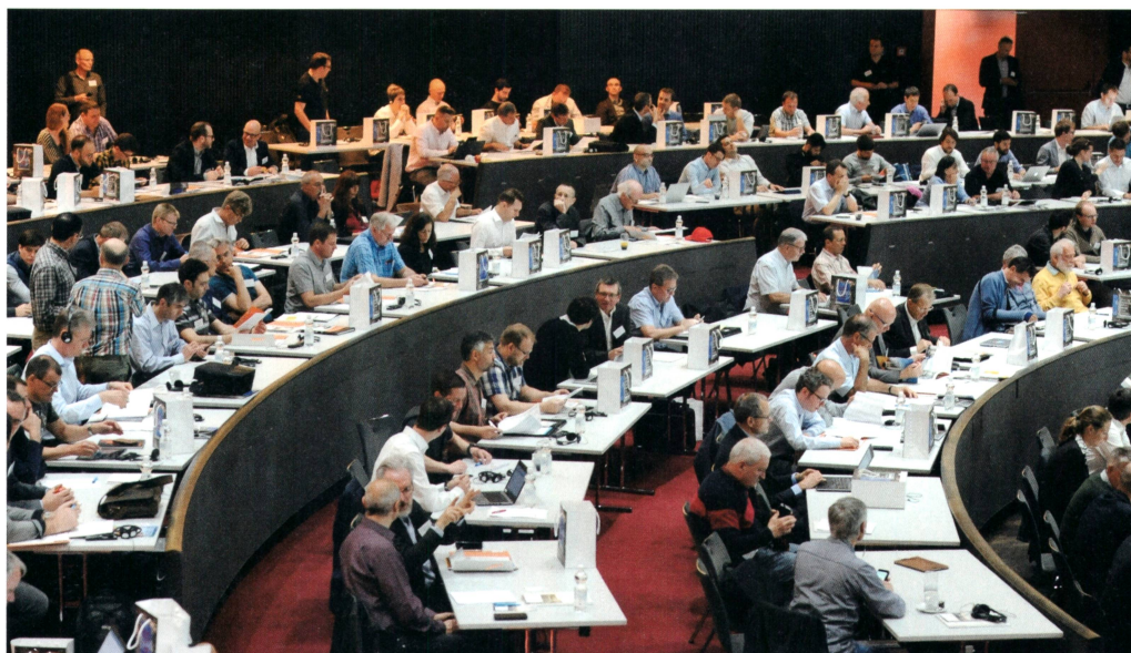
Rund 600 Teilnehmerinnen und Teilnehmer besuchten die 16. Nationale PV-Tagung in Bern.