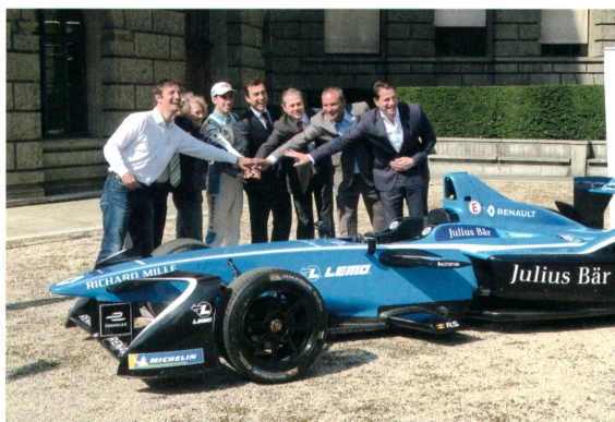
Veranstalter und Sponsoren des Zürcher E-Prix 2018 an der ETH Zürich.

Als weiterer Träger der FIA Formula E Meisterschaft tritt ABB als weltweiter