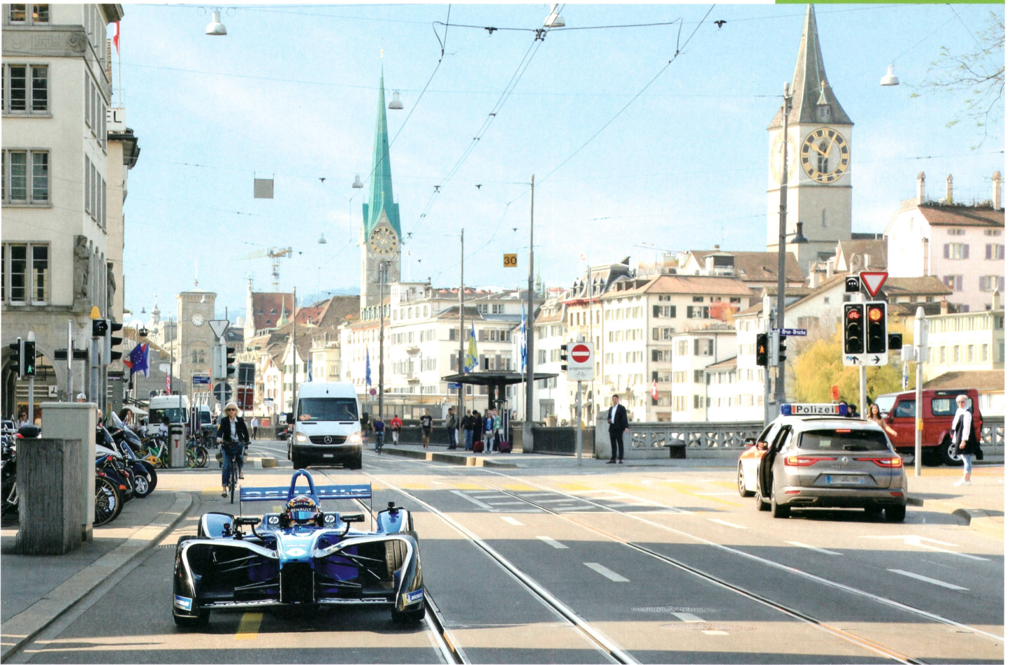
La Formule E de Sébastien Buemi fera bientôt à nouveau sensation dans les rues de Zurich.