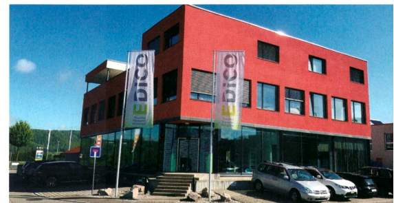
Der Firmensitz der Edico Engineering AG.

Beratung wird auch zu folgenden Themen angeboten: Optimierungskonzepte zur Energieverbrauchsreduktion, die Nutzung erneuerbarer Energien, EMV-, Blitzschutz, Erdungs- und