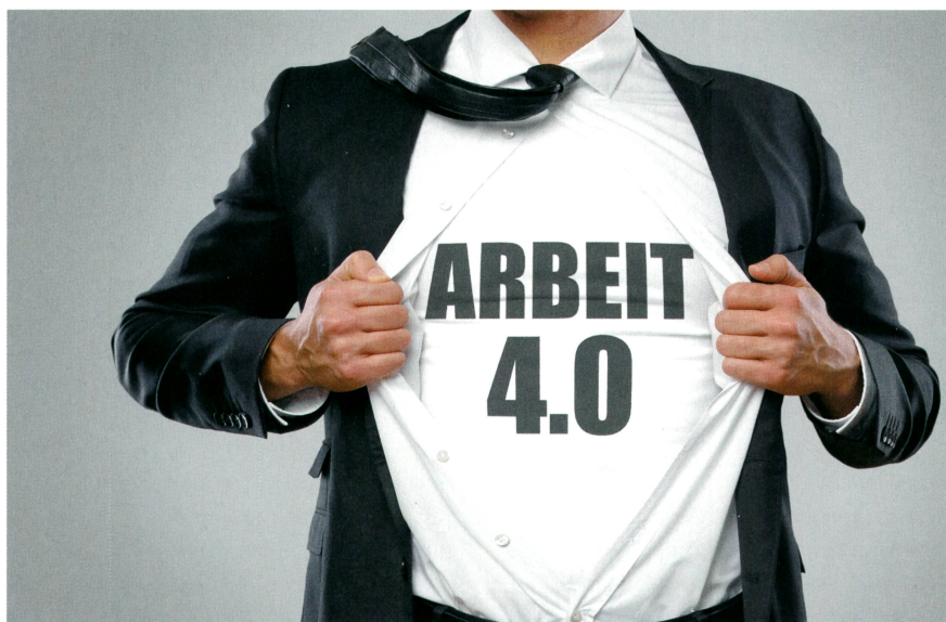
Neue Arbeitsmodelle der Zukunft bedingen flexibles Denken und Handeln.

Neue Arbeitsmodelle werden insbesondere deshalb gefragt, um auch den «war for talents» abzufedern, der