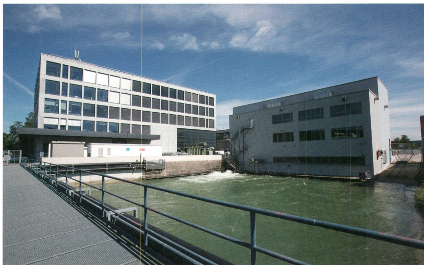
Das Maschinenhaus des Kraftwerks Dietikon.

Im Rahmen der Konzessionserneuerung Kraftwerk Dietikon erstellen die EKZ ein zusätzliches Dotierkraftwerk. In der zweiten Februarhälfte begannen die Bauarbeiten dazu. Das Werk wird unmittelbar unterhalb des Wehrs auf der EKZ-Insel erstellt und führt dem Limmatabschnitt zwischen Wehr und Kanalmündung künftig mehr Wasser zu, ohne die Stromproduktion zu reduzieren.