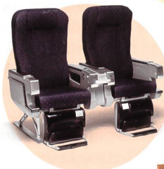
2 Trade World