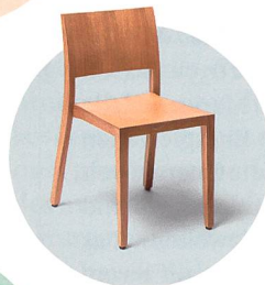
3 Local World