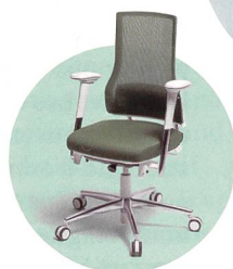
4 Smart World

1 «La transformation de l'approvisionnement énergétique en Europe a engendré de gros problèmes. Désormais, ce qui compte, c'est de disposer d'une production d'énergie sûre, fiable et éprouvée en Suisse.»