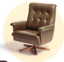
1 Trust World

Videos und weitere Informationen www.energiwelt.ch