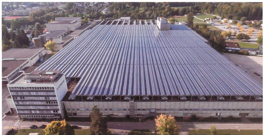
Von Microgrids profitieren Kunden und EVUs gleichermaßen.

Der klassische Weg: Verteilnetzbetreiber können ihre Netze verstärken. Dabei erhöhen sie die Übertragungskapazitäten der Leitungen und Transformatoren. Der innovative Weg: Sie digitalisieren ihr Netz, damit es «intelligent» und flexibler wird. So überwachen, steuern und optimieren sie es gezielt. Beide Varianten haben Vor- und Nachteile – und eine Gemein-