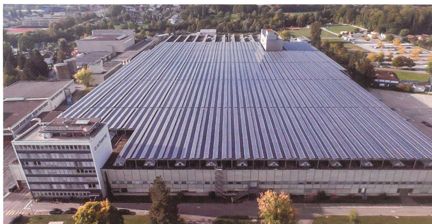
Von Microgrids profitieren Kunden und EVUs gleichermaßen.

Der klassische Weg: Verteilnetzbetreiber können ihre Netze verstärken. Dabei erhöhen sie die Übertragungskapazitäten der Leitungen und Transformatoren. Der innovative Weg: Sie digitalisieren ihr Netz, damit es «intelligent» und flexibler wird. So überwachen, steuern und optimieren sie es gezielt. Beide Varianten haben Vor- und Nachteile – und eine Gemein-