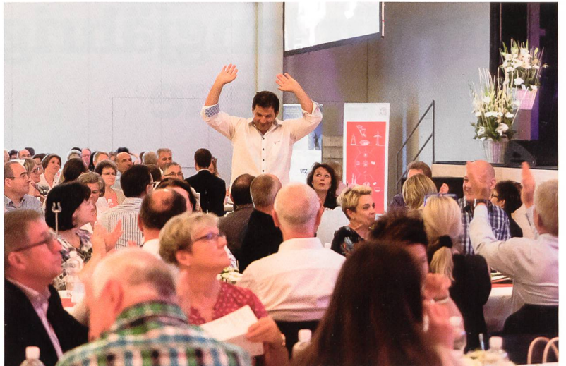
Die Jubilare liessen sich feiern. Les jubilaires ont été célébrés.