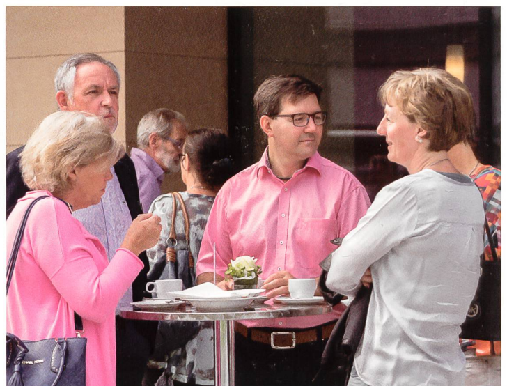
Der Anlass bot viele Gelegenheiten zu einem ungezwungenen Schwatz. La fête a offert la possibilité de tenir des conversations.