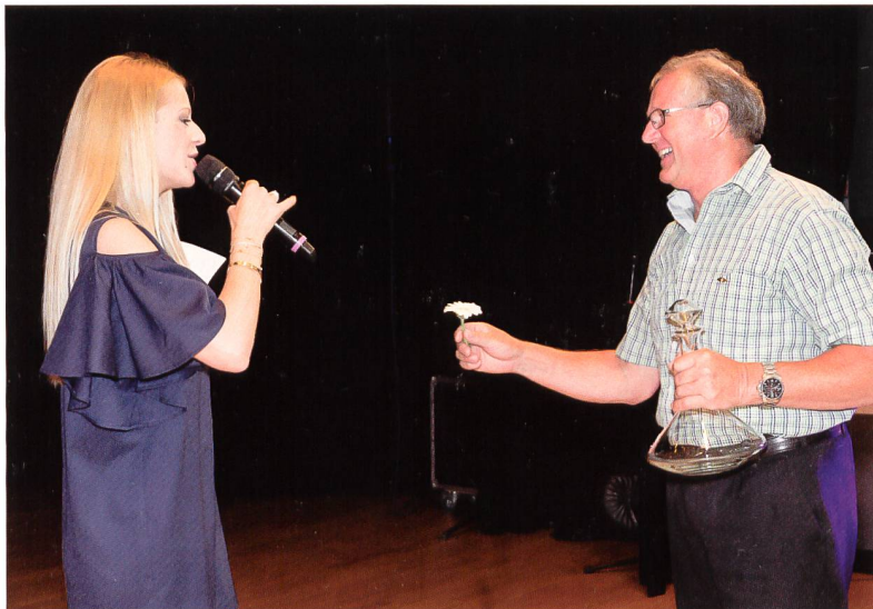
Sag's mit Blumen: Moderatorin Christa Rigozzi und ein Jubilar. Dites-le avec une fleur : l'animatrice Christa Rigozzi et un jubilaire.