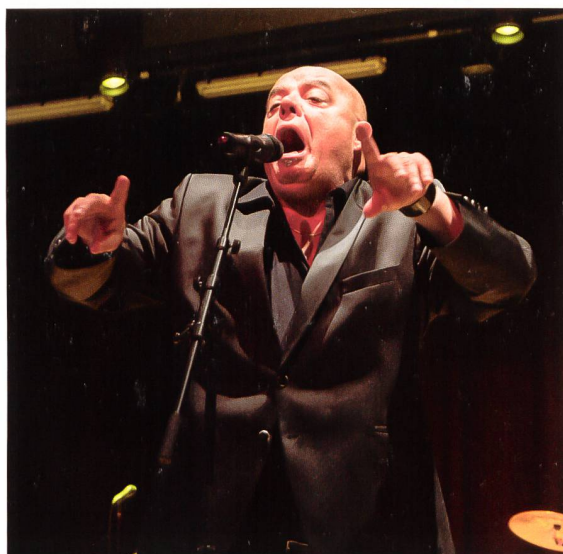
Mattscombo sorgte für Stimmung. «Mattscombo» a mis de l'ambiance.