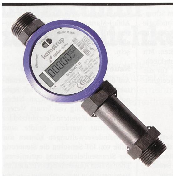
Ultraschall-Wasserzähler mit integriertem IoT-Sigfox-Funkmodul.

Für Stromversorger können die IoT-Funktechnologien eine ernsthafte Alternative zu den aktuell im Markt angebotenen PLC-Fernablesysteme-