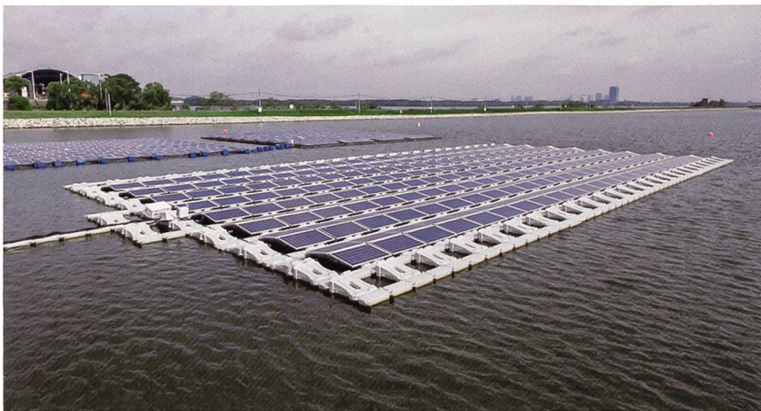
Centre de test de la plus grande centrale photovoltaïque flottante au monde.