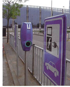
Borne de recharge EV-Box de Demelectric.

Dätwyler Cabling Solutions AG, 6460 Altdorf Tel. 041 875 12 68, www.cabling.datwyler.com