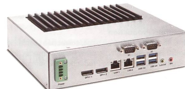
Industrie-PC Compact C6.

Pfisterer Sefag AG, 6102 Malters Tel. 041 499 72 72, ch.pfisterer.com