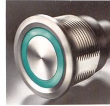
Die Produkte der CPS-Familie sind in den Durchmessern 16, 19 und 22 mm erhältlich.

Demelectric AG, 8954 Geroldswil Tél. 043 455 44 00, www.demelectric.ch