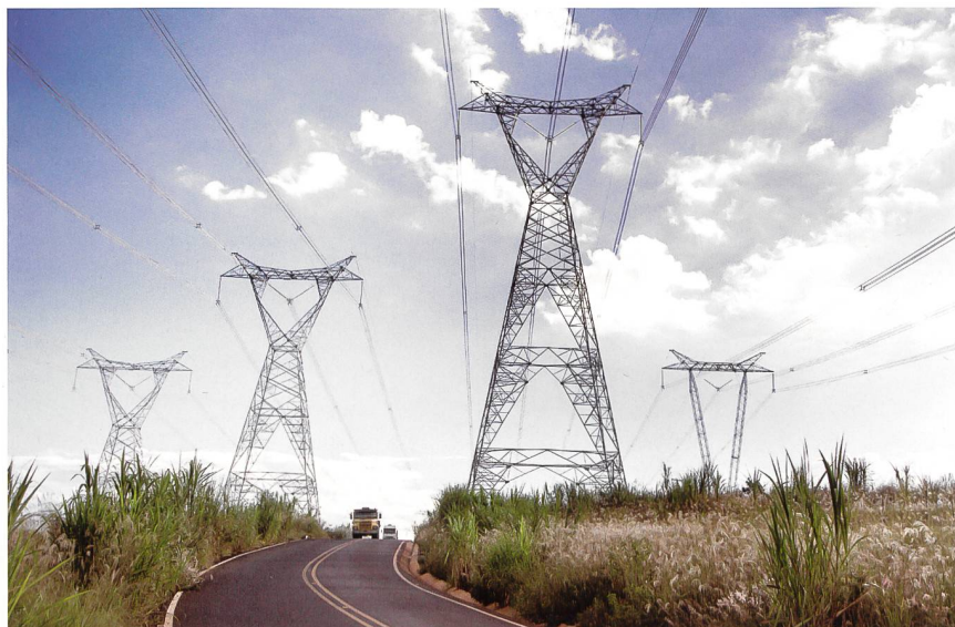
ABB liefert Transformatoren für eine Hochspannungsleitung in Brasilien

Dank der Konvertertransformatoren von ABB wird die 800-Kilovolt-UHGÜ-Leitung Belo Monte künftig rund zehn Millionen Menschen mit Strom versorgen.