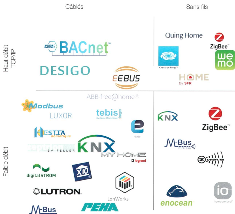
Figure 4 Liste non exhaustive de technologies et de protocoles disponibles sur le marché des maisons intelligentes.

que Google (Android), Apple (iOS) et Microsoft (Windows).