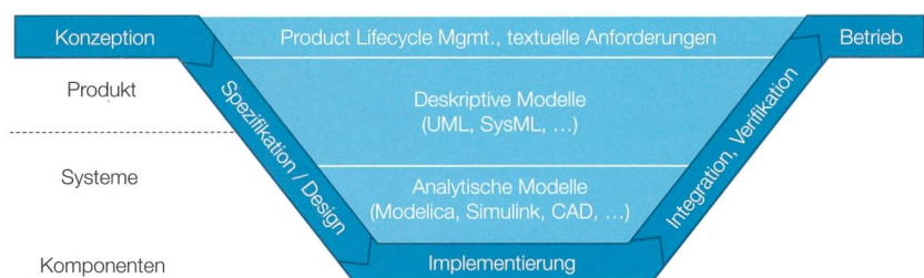
Bild 1 Klassisches V-Modell.

Aktuelle Modellierungsumgebungen und Simulationssoftware sind in der Lage, für eine Vielzahl von Systemen die Korrektheit von Anforderungen sehr früh untersuchbar zu machen. Der nächste Schritt liegt nun in der Erweiterung dieser Konzepte vom linken «Ast» des «V» zum rechten. Bei der virtuellen Systemintegration wird die Taktung der Integration anhand der Spezifikations- bzw. Designebenen des Produkts aufgebrochen, und anstelle noch unfertiger Teile treten Simulationen, also virtuelle Elemente des Produkts: Ein Teil des Produkts (z.B. die Mechanik) liegt schon in einer realen Form vor, während z.B. embedded Hard- und Software noch als Modell in PC-basierten Modellumgebungen abgebildet sind. Heutige Modellierungssprachen erlauben meist eine genaue Parametrisierung des stationären und dynamischen Verhaltens des eingebetteten Systems, um die physikalischen Schnittstellen zwischen modellbasiertem, virtuellen Teil und realem Teil charakterisieren zu können. In einer weiteren Phase der Entwicklung kann dann z.B. die Software für das eingebettete System bereits vorliegen, während die Hardware immer noch in virtueller Form auf einer computergestützten Anlage verwendet wird. Entscheidend für die Realitätstreue des Gesamtverhaltens ist in der Praxis oft das Timing: Reales Verhalten enthält kleine Totzeiten und andere geringe Abweichungen der Dynamik, die sich entscheidend auf das feine Zusammenspiel von digitalen und physikalischen Anteilen des Produkts auswirken können. Zu