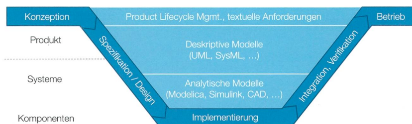
Bild 1 Klassisches V-Modell.

Ein grosses Problem jeder Entwicklung von immer komplexer werdenden Systemen ist, dass Spezifikationsfehler bzw. Designfehler oft erst kurz vor der