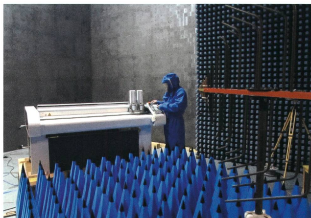
Bild 1 Es kommt oft vor, dass ein Gerät bei der EMV-Prüfung (bis 20 V/m) bedient oder direkt überwacht werden muss.

Funktionen eines Prüflings, die für sicherheitsbezogene Anwendungen benutzt werden, dürfen nicht ausserhalb ihrer Spezifikation beeinflusst werden oder können vorübergehend oder dauerhaft gestört werden, falls der Prüfling auf eine Störung so reagiert, dass ein feststellbarer definierter Zustand (DS) eingestellt oder in einer bestimmten Zeit erreicht wird. Das Bewertungskriterium DS (Defined State) wurde früher als FS (Fail Safe) bezeichnet. Auch eine Zerstörung ist erlaubt, falls ein feststellbarer, definierter Zustand (oder Zustände) eingestellt oder in einer bestimmten Zeit erreicht wird.