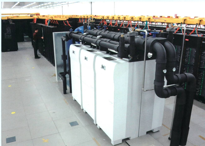
Der Coolmuc-2-Rechencluster (links) liefert die Antriebswärme für sechs Adsorptionskältemaschinen im Leibniz-Rechenzentrum.