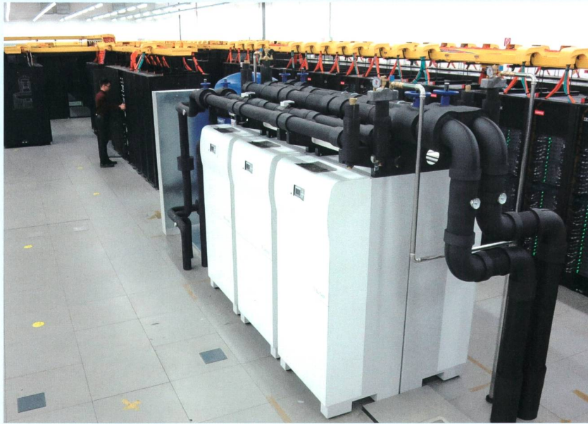
Der Coolmuc-2-Rechencluster (links) liefert die Antriebswärme für sechs Adsorptionskältemaschinen im Leibniz-Rechenzentrum.