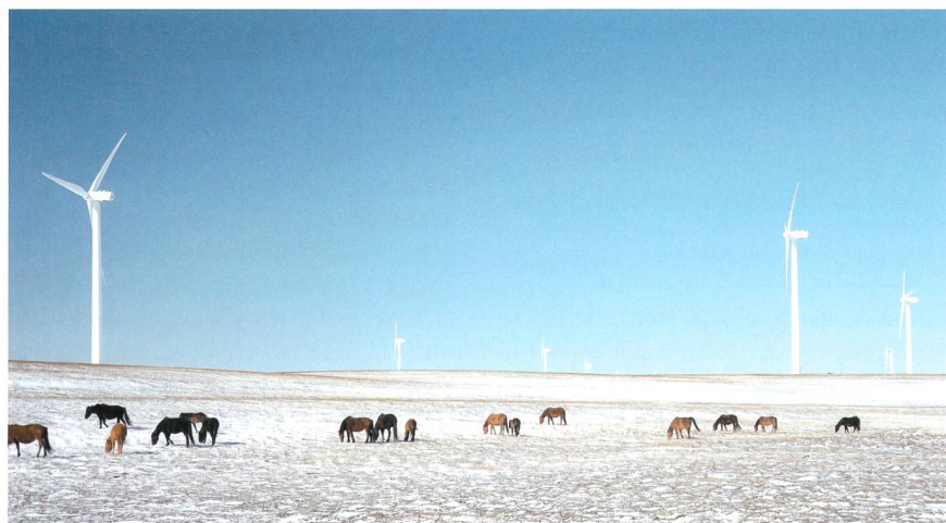
Windfarm in China. Die grossen Energieressourcen befinden sich im Westen und Nordwesten Chinas.