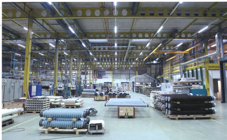
Figure 2 Le domaine de l'éclairage présente souvent un potentiel important d'économies.

Les participants ayant obtenu un soutien financier passent ensuite à la phase de réalisation durant laquelle les spécialistes en efficacité énergétique des entreprises fondatrices peuvent les accompagner. Afin de vérifier l'efficacité des mesures soutenues, des experts effectuent un monitoring comptabilisant les économies réelles. Les entreprises et collectivités publiques peuvent également bénéficier d'un soutien financier pour ce monitoring. Une fois que l'efficacité des mesures est démontrée, les participants reçoivent les contributions financières correspondantes.