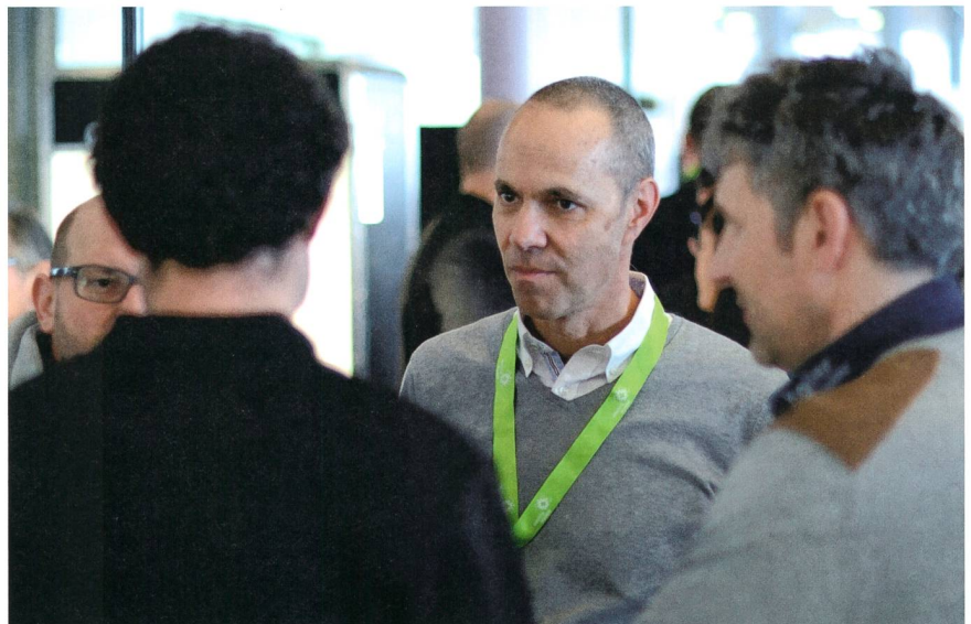
Die Pausen wurden für regen Meinungsaustausch genutzt.