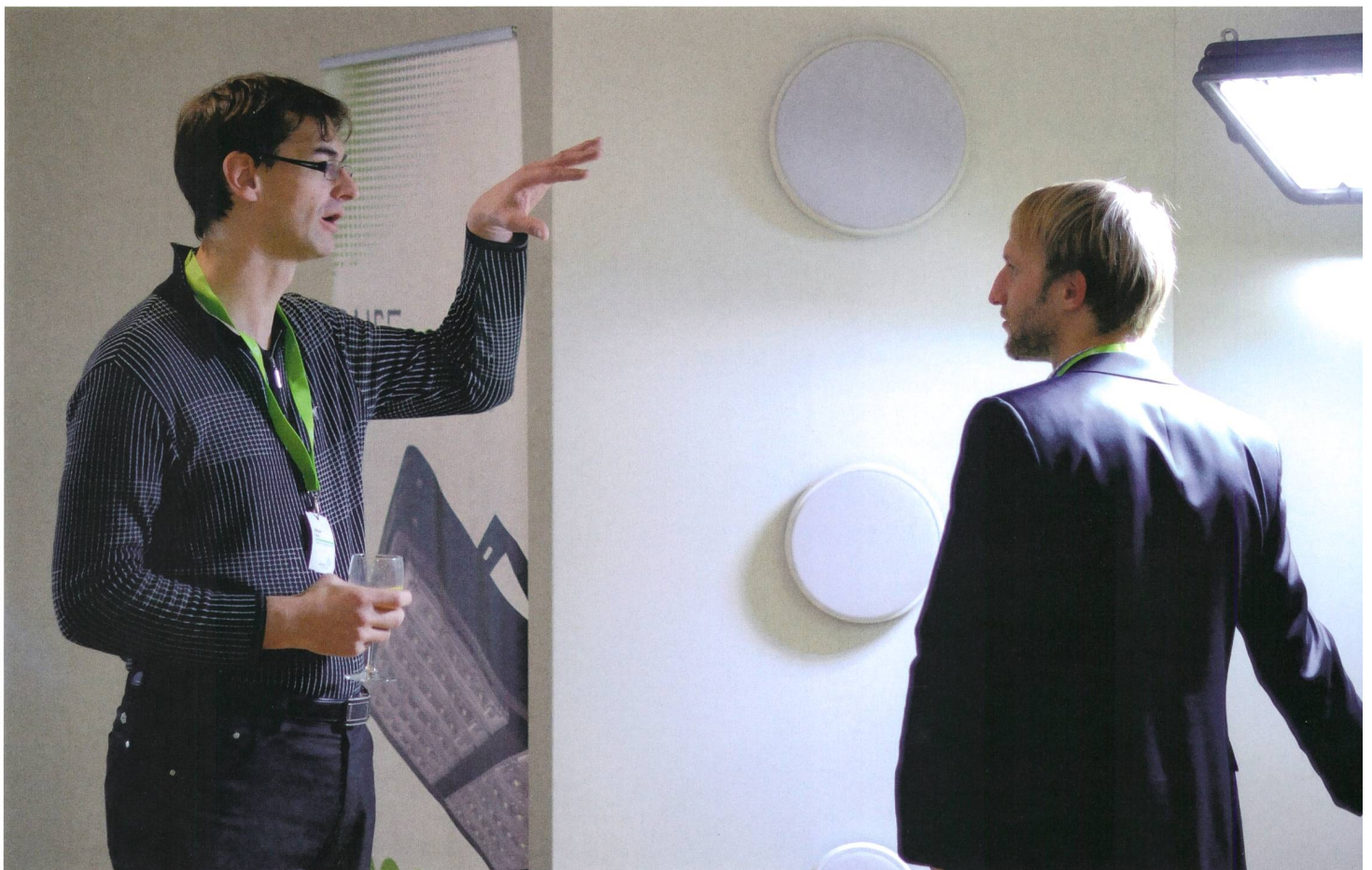
Neuigkeiten konnte man an der Ausstellung aus der Nähe betrachten und ihre Qualitäten diskutieren.