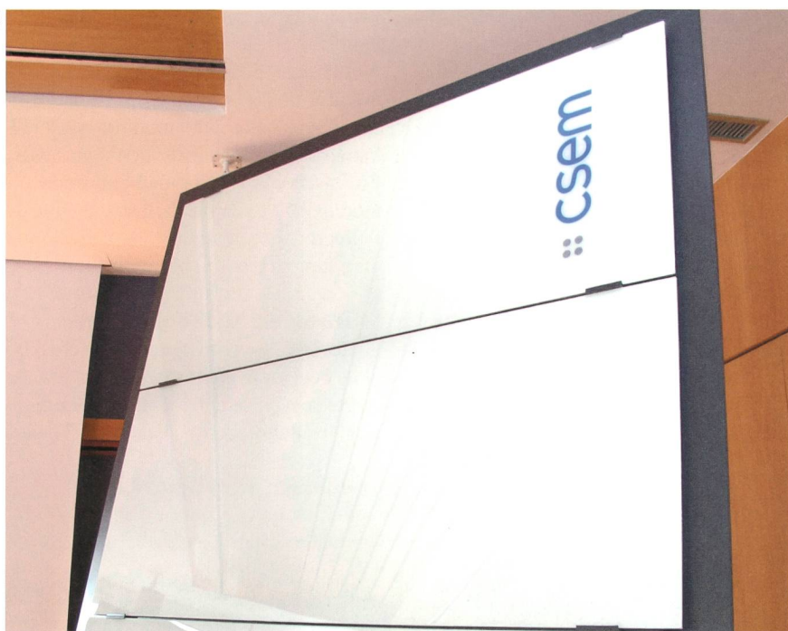
Figure 1 Prototypes de modules photovoltaïques blancs réalisés au CSEM.

Il faut cependant savoir que le blanc est la couleur qui reflète (traduisez: rejette) la majorité de la lumière, une propriété totalement contraire à ce que l'on souhaite d'un panneau solaire standard. Malgré la forte demande des milieux de la construction, personne n'avait été en