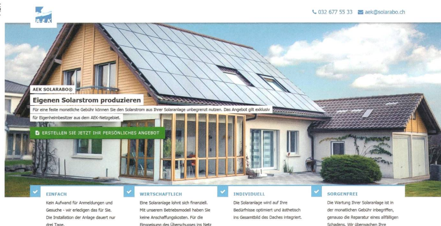
Bild 2 Als einer der ersten Energieversorger setzt AEK das Konzept des Solarleasings in der Schweiz um. Gegen eine monatliche Gebühr können die Kunden eine Solarstromanlage auf dem eigenen Dach nutzen. Der Screenshot zeigt die Website der Vertriebs-Plattform, auf der Interessenten mit einem Mausklick eine massgeschneiderte Offerte anfordern können.

Wie bereits erwähnt, haben denn auch diverse EVUs eine Solarabteilung aufgebaut oder dazugekauft. Und einige EVUs halten Solarkonzepte in der Schublade, um reagieren zu können, falls sich der Markt mit dem Eigenverbrauch schneller als erwartet entwickelt. Doch warum steigen EVUs ins Solargeschäft ein und konkurrenzieren sich gewissermassen selber? Dafür spricht, dass die Verbreitung von Solaranlagen zur Eigenversorgung kaum mehr aufgehalten werden kann. Mit anderen Worten: Angesichts des drohenden Absatzverlusts möchten sie wenigstens mit dem Verkauf der Solaranlage einmalig daran verdienen.