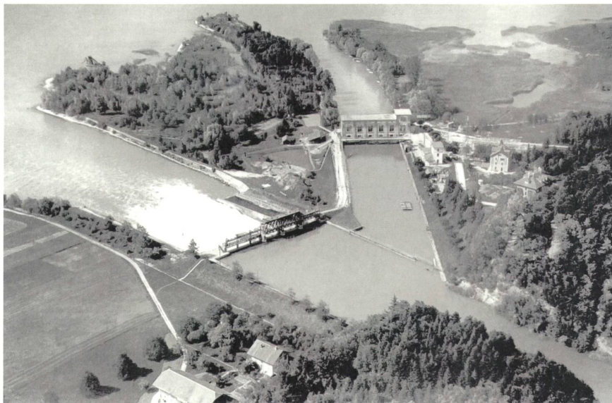
Figure 2 La centrale hydroélectrique de Hagneck aux alentours de 1920.