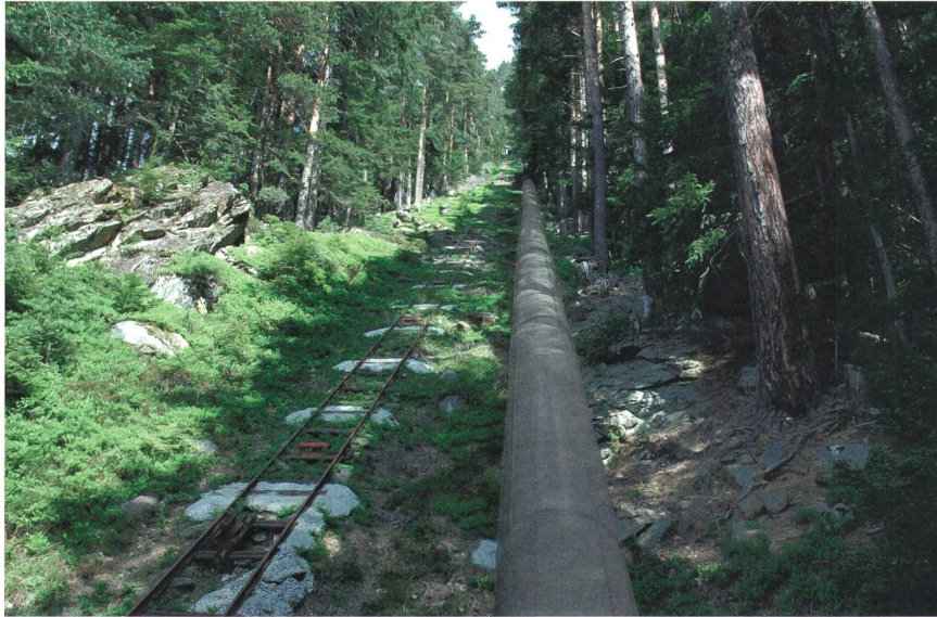
Bild 2 Die zu ersetzende Druckleitung.

fizienter genutzt werden. Hierfür wurden im Rahmen einer umfassenden Evaluierung zunächst sechs Varianten ausgearbeitet. Die Entscheidung fiel schliesslich zugunsten einer Laufwasserkraftwerk-Variante, die eine Erhöhung der Ausbauwassermenge von 1,4 \text{ m}^3/\text{s} auf 2 \text{ m}^3/\text{s} sowie die installierte Maschinenleistung von bislang 6 MW auf 10 MW vorsieht. Damit wird eine Produktionssteigerung von rund 23 % gegenüber dem bisherigen Werk möglich.