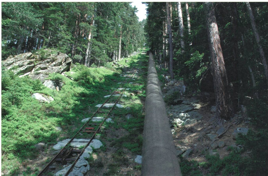
Bild 2 Die zu ersetzende Druckleitung.

fizienter genutzt werden. Hierfür wurden im Rahmen einer umfassenden Evaluierung zunächst sechs Varianten ausgearbeitet. Die Entscheidung fiel schliesslich zugunsten einer Laufwasserkraftwerk-Variante, die eine Erhöhung der Ausbauwassermenge von 1,4 \text{ m}^3/\text{s} auf 2 \text{ m}^3/\text{s} sowie die installierte Maschinenleistung von bislang 6 MW auf 10 MW vorsieht. Damit wird eine Produktionssteigerung von rund 23% gegenüber dem bisherigen Werk möglich.