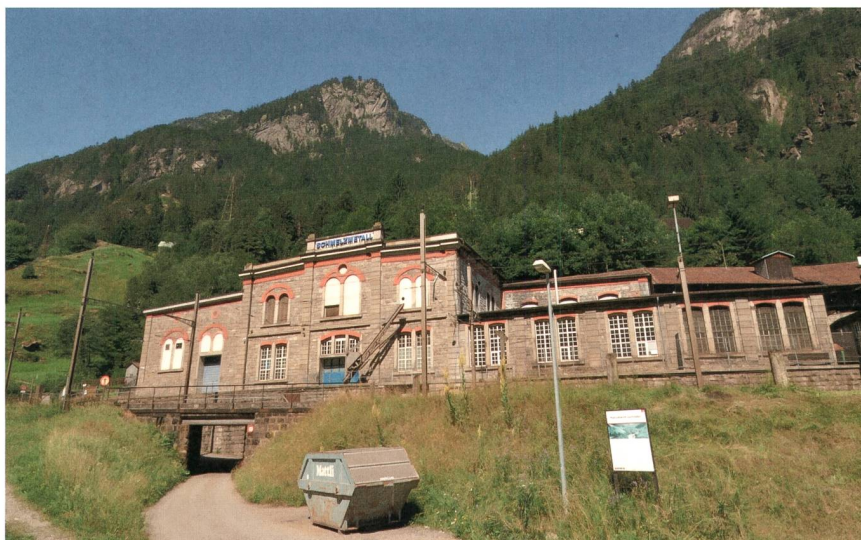
Bild 1 Kraftwerksgebäude in Gurtellen.

Bei dem Erneuerungsprojekt stand neben der Optimierung der Gesamtanlage insbesondere die Steigerung der Produktionsmenge im Vordergrund. Dies, weil die jetzige Anlage bezüglich der Wasserführung des Gornerenbachs nicht optimal ausgebaut ist: An über 100 Tagen im Jahr herrscht Überschusswasser, das ungenutzt über die Wehranlage fliesst. Dieses Überschusswasser soll künftig ef-