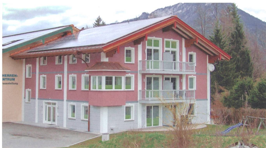
L'immeuble « Effizienzhaus Plus » de Bischofswiesen génère plus d'énergie qu'il n'en consomme.