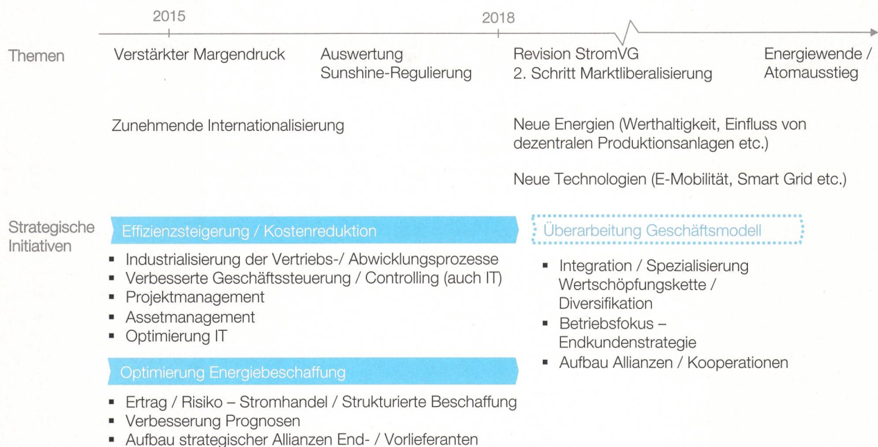
Bild 2 Häufig erwähnte Herausforderungen und typische strategische Gegeninitiativen in der Schweizer Strombranche.

nehmerische Freiheiten mit sich, welche strategische Entscheidungen und somit häufig auch Investitionen erfordern. Aus diesen Entscheidungen folgen wiederum neue Projekte, welche Risiken beinhalten bezüglich ihrer Qualität, der Zeitplanung und der kalkulierten Kosten. Es werden nicht nur Investitionsprojekte durchgeführt, um Dienstleistungen auszubauen, sondern auch viele organisatorische Initiativen ergriffen, wie Effizienzsteigerungen oder Standardisierung von Prozessen, die Einführung von neuen IT-Systemen sowie das Aufsetzen von professionellen Assetmanagements.